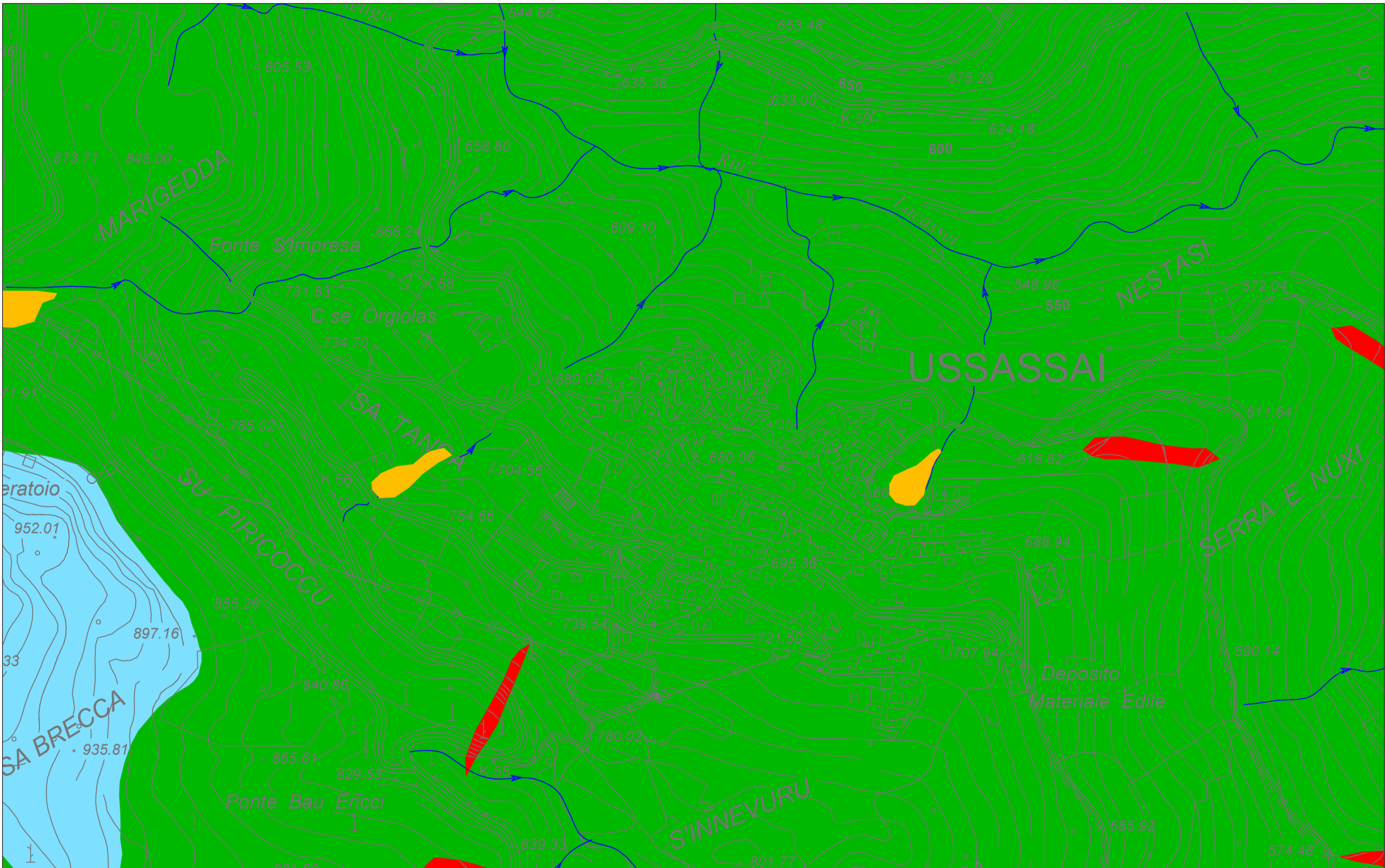
CARTA GEOLOGICA Base carta: CARTA TECNICA REGIONALE 1:10.000 Scala 1 : 5.000