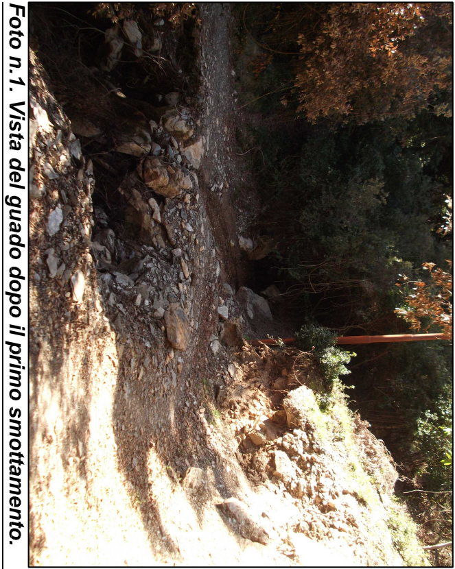
Foto n.1. Vista del guado dopo il primo smottamento.