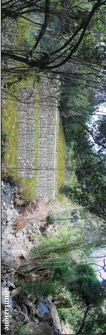
Foto n.8. Simulazione intervento.

REGIONE AUTONOMA DELLA SARDEGNA ASSESSORATO DEI LAVORI PUBBLICI (L.R. n°7/2014,ART.5, COMMA 16, MODIFICATA DALLA l.r. 9/2014, ART.1)