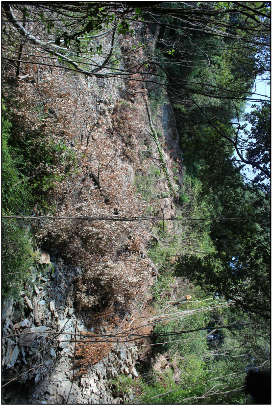
Foto n.5. Vista strada dopo il secondo smottamento.