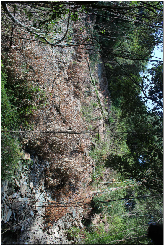
Foto n.6. Vista del secondo smottamento da valle.