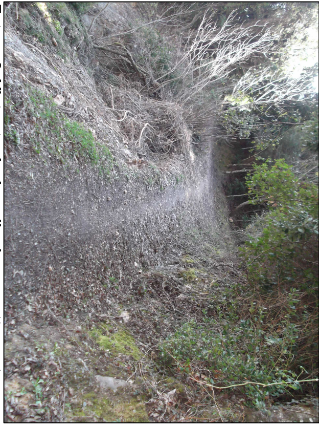
Foto n. 3. Vista strada dopo il primo smottamento.