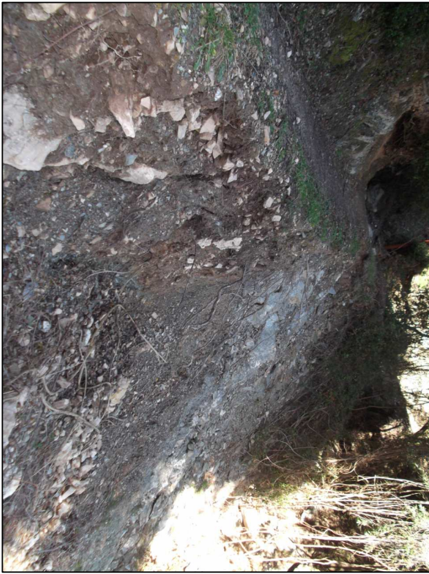
Foto n.4. Vista strada dopo il primo smottamento.