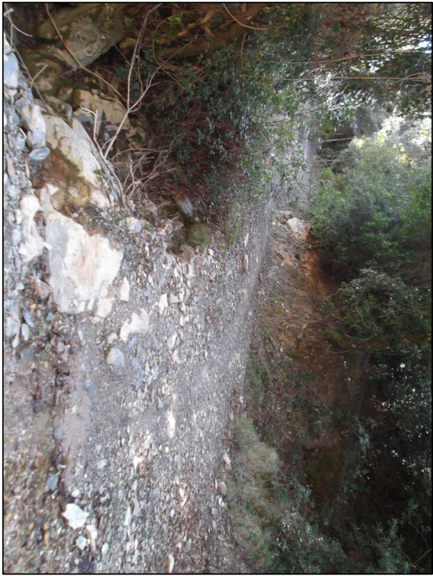
Foto n. 2. Vista strada dopo il primo smottamento.