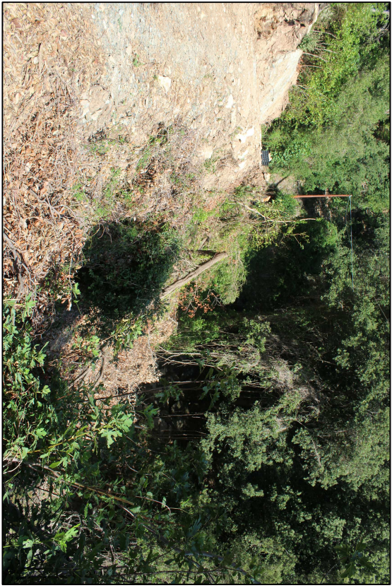
Foto n.7. Vista strada dopo il secondo smottamento