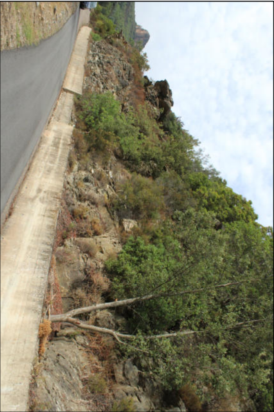
Foto n. 5. Intervento 1C-Masso aggettante da demolire