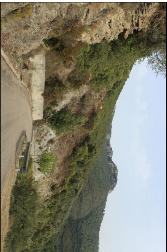
Foto n. 3. Intervento 1A. Prosecuzione e Realizzazione muro di sottoscarpa