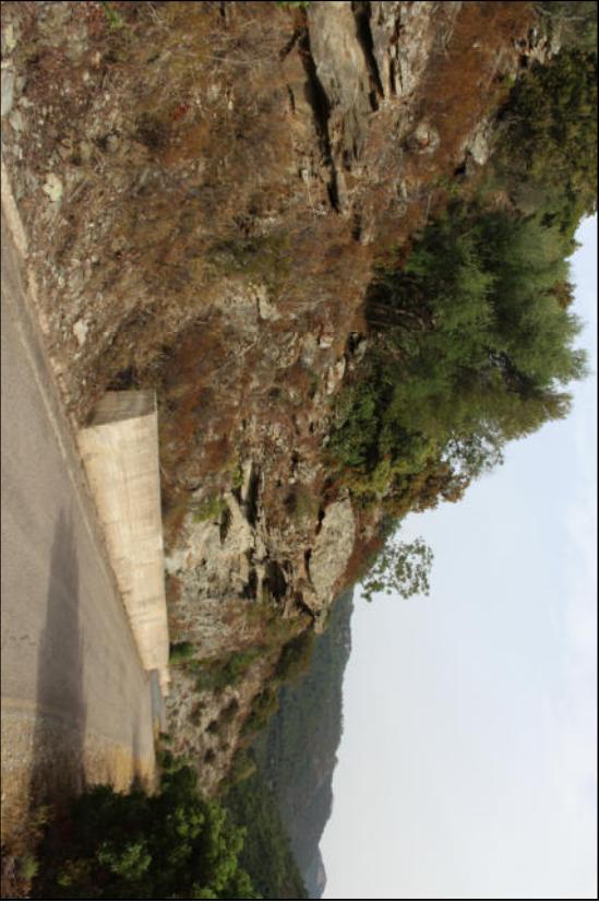
Foto n. 7. Intervento 1D-Masso aggettante da demolire