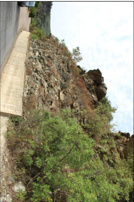
Foto n. 6. Intervento 1C-Masso aggettante da demolire Rafforzamento corticale con geo composito metallico con ancoraggi in maglia quadrata