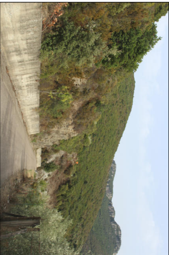
Foto n. 4. Intervento 1B. Rafforzamento corticale con geo composito metallico con ancoraggi in maglia quadrata