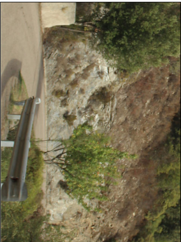
Foto n. 2. Intervento 1A. Prosecuzione e Realizzazione muro di sottoscarpa