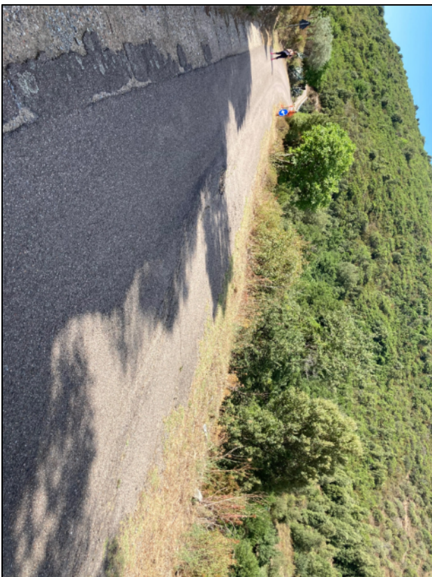
Foto n. 1. Intervento 1A. Realizzazione a valle strada di muro in gabbioni