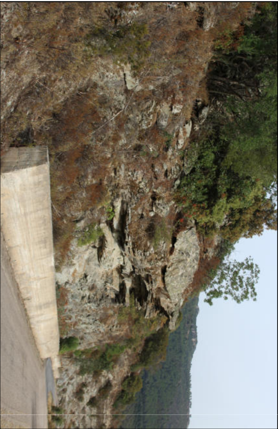
Foto n. 8. Intervento 1D-Masso aggettante da demolire. Rafforzamento corticale con geo composito metallico con ancoraggi in maglia quadrata